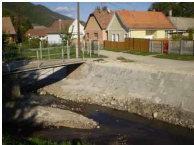
A helyreállított patakmeder

A Pastinszkyék előtti szakaszon ékelt meder kövel biztosították a rézsút, lentebb pedig a meder helyreállítása kezdődött meg.