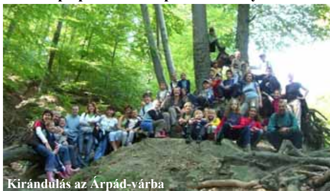
Kirándulás az Árpád-várba