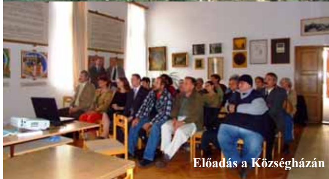
Előadás a Községházán