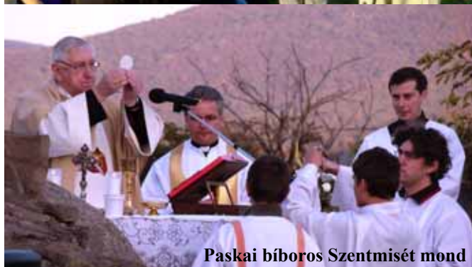
Paskai bíboros Szentmisét mond