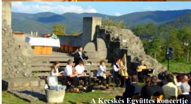
A Kecskés Együttes koncertje